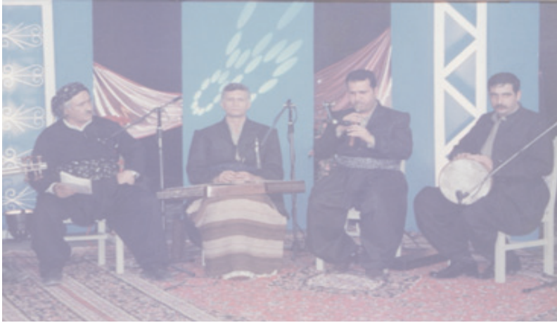
گروپی موسیقی گەریان، ۲۰۰۲