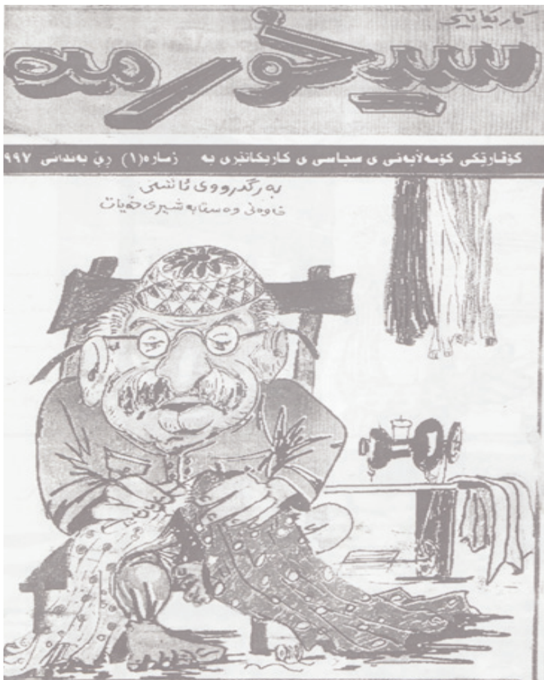
یه کهم ژماره ی گوٹاری سیخورمه