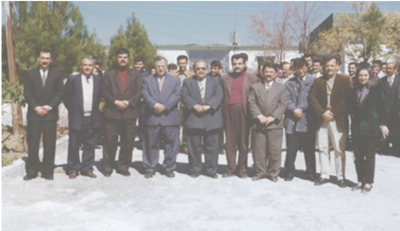
سه‌ردانی سه‌رۆک مام جه‌لال بۆ ناوه‌ندی چاپه‌مه‌نی و راگه‌یاندنی خاک