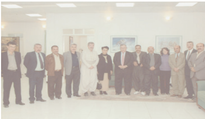
هٲرؤ خان و سه رؤك مام جه لال له گهل ستافٲ به رنامهٲ به رنامه