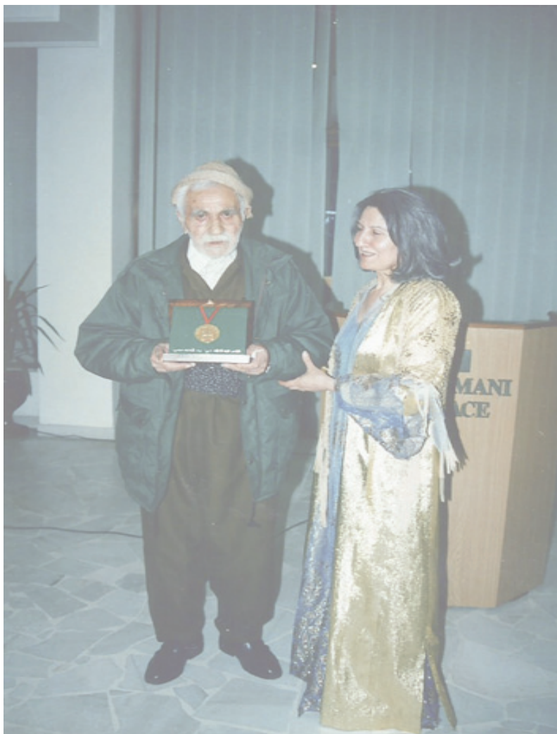
هيرو خان و هونهرمهٲد قاله مهٲره