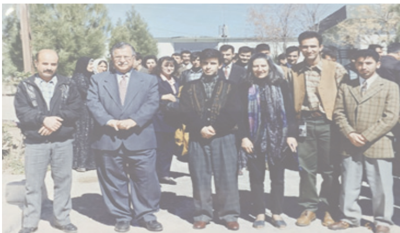
سه‌ردانى سه‌رۆك مام جه‌لال بۆ ناوه‌ندى چاپه‌مه‌نى و راگه‌يه‌ندنى خاک، سالى ١٩٩٩