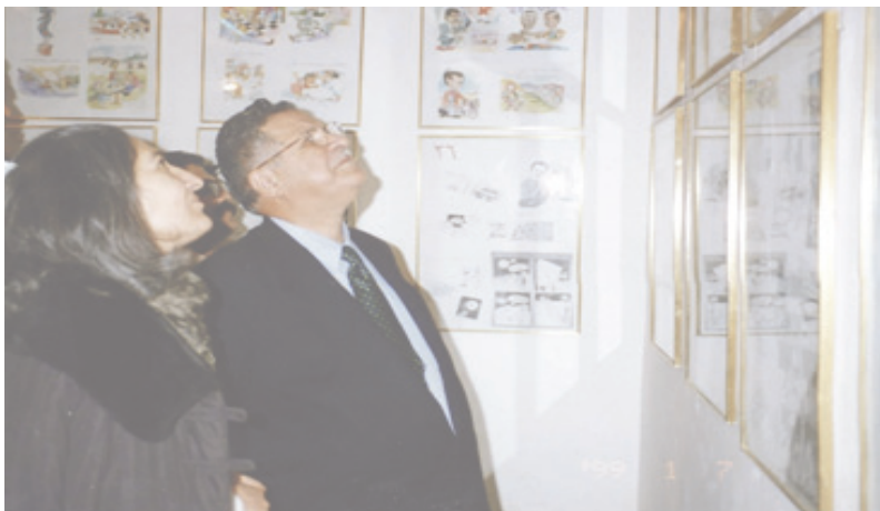
سه روک مام جه لال و هیرو خان له پیشانگه یه کی تایبه تی کاریکاتیریدا