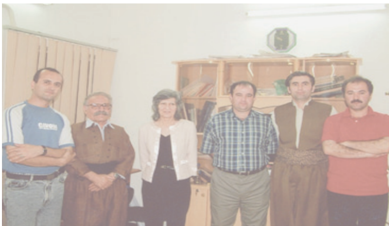
هونه رمه ندانٲ رؤژه لاتی كوردستان له گهل هٲرؤ خاندا